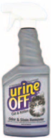
Urine Off Cat Formula Met spuitkop