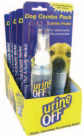
Urine Off Dog & Puppy Formula Spuutkop plus LED Urine Finder in de countertopdisplay Inhoud: 4 FL OZ / 118 ml

De Mini Combo Kit is op de markt gebracht om de consument een manier te bieden om urinegeuren en urine te lijf te gaan, met Urine Off 4 FL OZ / 118 ml. Urine Finder Mini-LED Inspection Light is de perfecte impulsaankoop voor huisdierbezitters. Nu kan de consument de bron van de urinegeur vinden met behulp van de Urine Finder Mini-LED Light of ze daarna te behandelen met Urine Off. De revolutionaire LED technologie maakt de urine makkelijk zichtbaar, waarmee het de consument tijd en geld bespaart. Urine Off 4 FL OZ / 118 ml. Reis/probeerverpakking is ontworpen voor het gemak. Makkelijk op te bergen in handtassen, draagtassen, handschoenenkastjes en reiskits, de reis/probeerverpakking van 4 FL OZ / 118 ml is de perfecte impuls aankoop. Omdat ze beschikbaar zijn bij de kist of bij de countertopdisplay of bij de hangertjes, zijn de nieuwe Urine Off combopakketten enorm populair bij de consument. Als onderdeel van een uitgebreide verpakking -en handelstrategie om de nieuwe consument kan de Urine Off 4 FL OZ / 118 ml. combo reis/probeerverpakking op verschillende plekken worden gezet om extra aankoop te genereren. Nu kan de consument Urine Off uitproberen tegen een fractie van de prijs. Als de consument eenmaal Het effect van de Urine Off ontdekt heeft, wil deze niet meer anders!