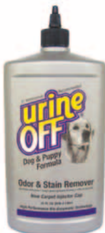
Urine Off Dog Formula met inspuitskapje voor tapijt