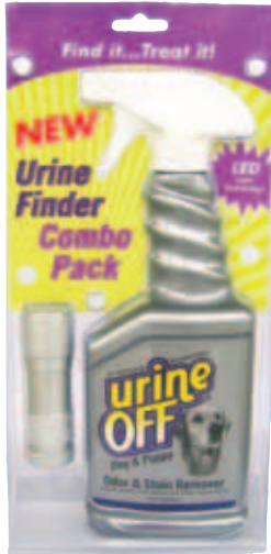
Urine Off Dog & Puppy Formula 500 ml Spuitkop plus LED Urine Finder Inhoud: 500 ml