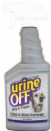
Urine Off Dog Formula met spuitkop