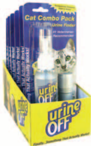
Urine Off Cat & Kitten formula Spuitskop plus LED Urine Finder in de countertopdisplay Inhoud: 4 FL OZ / 118 ml

De Mini Combo Kit is op de markt gebracht om de consument een manier te bieden om urinegeuren en urine te lijf te gaan, met Urine Off 4 oz. Bespuit met een Urine Finder Mini-LED Inspection Light is de perfecte impuls aankoop voor huisdierbezitters. Nu kan de consument de bron van de urinegeur vinden met behulp van de Urine Finder Mini-LED Light of ze daarna te behandelen met Urine Off. De revolutionaire LED technologie maakt de urine makkelijk zichtbaar, waarmee het de consument tijd en geld bespaart. Urine Off 4 oz. reis/probeerverpakking is ontworpen voor het gemak. Makkelijk op te bergen in handtassen, draagtassen, handschoenenkastjes en reiskits, de reis/probeerverpakking van 4 oz is de perfecte impuls aankoop. Omdat ze beschikbaar zijn bij de kist of bij de countertopdisplay of bij de hangertjes, zijn de New Urine Off Combo Packages enorm populair bij de consument. Als onderdeel van een uitgebreide verpakking -en handelstrategie om de nieuwe consument kan de Urine Off 4 oz. combo reis/probeerverpakking op verschillende plekken worden gezet om extra aankoop te genereren. Nu kan de consument Urine Off uitproberen tegen een fractie van de prijs. Als de consument eenmaal het effect van de Urine Off ontdekt heeft, wil deze niet meer anders!