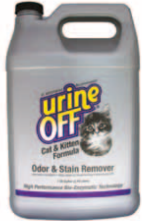
Urine Off Cat formula met 38 mm kapje