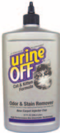
Urine Off Cat formula Met inspuitskapje voor tapijt