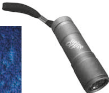
Urine Off LED Mini Urine Finders