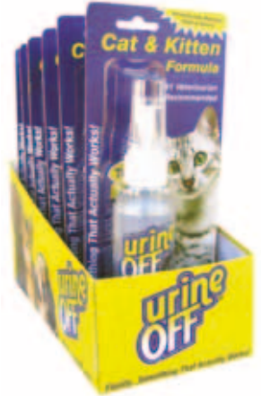
Urine Off Cat & Kitten formula Spuutkop met countertopdisplay Inhoud: 4 FL OZ / 118 ml

Urine Off 4 FL OZ / 118 ml reis/probeerverpakking is ontworpen voor het gemak. Makkelijk op te bergen in handtassen, draagtassen, handschoenenkastjes en reiskisten, het reis/probeerverpakking van 4 FL OZ / 118 ml is de beste impulsaankoop. Omdat ze beschikbaar zijn bij de kist of bij de countertopdisplay of bij de hangertjes, zijn de nieuwe Urine Off pakketten enorm populair bij de consument. Als onderdeel van een uitgebreide verpakking -en handelstrategie om Urine Off te introduceren bij de nieuwe consument, kan Urine Off 4 FL OZ / 118 ml reis/probeerverpakking op verschillende plekken worden geplaatst om extra verkoop te genereren. Nu kan de consument Urine Off uitproberen tegen een fractie van de prijs. Als de consument eenmaal het effect van Urine Off heeft ontdekt, zullen ze niets anders meer willen!