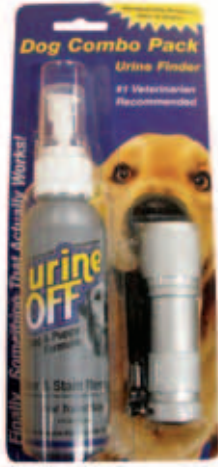
Urine Off Dog & Puppy Formula Spuutkop plus LED Urine Finder Inhoud: 4 FL OZ / 118 ml