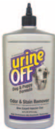
Urine Off Dog Formula met inspuitskapje voor tapijt