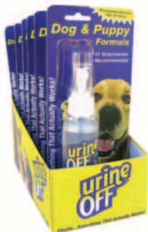
Urine Off Dog & Puppy Formula Spuutbus met countertopdisplay Inhoud: 4 FL OZ / 118 ml

Urine Off 4 FL OZ / 118 ml reis/probeerverpakking is ontworpen voor het gemak. Makkelijk op te bergen in handtassen, draagtassen, handschoenenkastjes en reiskisten, de reis/probeerverpakking van 4 FL OZ / 118 ml is de beste impulsaankoop. Omdat ze beschikbaar zijn bij de kist of bij de countertopdisplay of bij de hangertjes, zijn de nieuwe Urine Off pakketten enorm populair bij de consument. Als onderdeel van een uitgebreide verpakking -en handelstrategie om Urine Off te introduceren bij de nieuwe consument, kan Urine Off 4 FL OZ / 118 ml reis/probeerverpakking op verschillende plekken worden geplaatst om extra verkoop te genereren. Nu kan de consument Urine Off uitproberen tegen een fractie van de prijs. Als de consument eenmaal het effect van Urine Off heeft ontdekt, zullen ze niets anders meer willen!