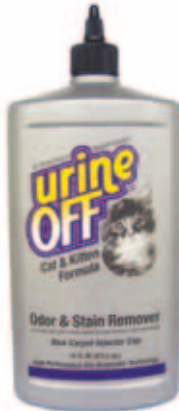
Urine Off Cat formula Met inspuitskapje voor tapijt