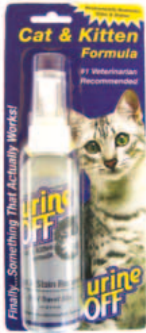
Urine Off Cat & Kitten formula Spuutbus in blisterverpakking Inhoud: 4 FL OZ / 118 ml