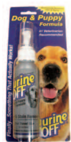
Urine Off Dog & Puppy Formula Spuutbus in blisterverpakking Inhoud: 4 FL OZ / 118 ml