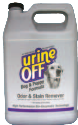
Urine Off Dog Formula met 38 mm kapje