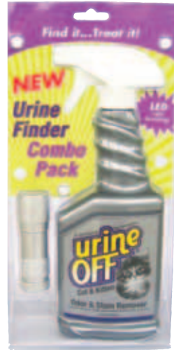
Urine Off Cat & Kitten Formula 500 ml Spuitkop plus LED Urine Finder Inhoud: 500 ml

Perfect voor de countertop of winkelplank, de nieuwe Urine Off 500 ml Het Spray Combo package is een grote flacon met spuitkop met een Urine Finder Mini-LED Light. Nu kan de consument zelf de bron van onzichtbare urinegeuren vinden met behulp van de Urine Finder Mini-LED Light om ze vervolgens te behandelen met Urine Off. De revolutionaire LED technologie maakt de urine makkelijk zichtbaar, waarmee het de consument tijd en geld bespaart.