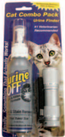
Urine Off Cat & Kitten formula Spuitskop plus LED Urine Finder Inhoud: 4 FL OZ / 118 ml